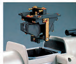
エアードンパー方式コンベンセーター

補正鏡は望遠鏡の平行光束中にあり、本機の傾きによる補正鏡の位置変化時の補正誤差、ピントのズレによる像のボケは生じません。また、振子は特殊弾性リボン材で逆台形に吊られており、本機の傾きに対し6倍の敏感さで補正します。さらに、使用条件に左右されず永久的に制動効果を発揮する空気制動方式ダンパー、エアースキ間が広く微振動の制動にも効果がある特殊構造のピストン・シリンダーを採用しており、常に安定した精度を維持します。